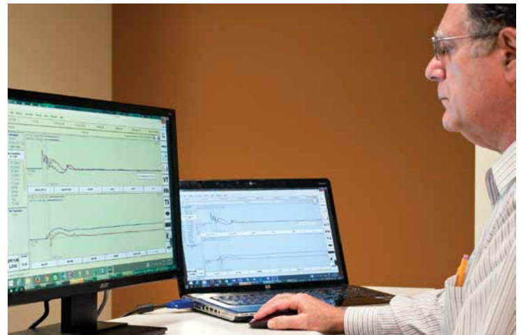
Recibiendo datos de la prueba con SiteLink.