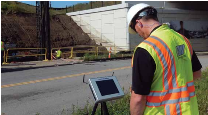
PDA-8G en el campo

El PDA-8G tiene nuevas características que facilitan las pruebas en pilotes taladrados, como la opción de llevar a cabo la prueba con cuatro o más transductores de deformación inalámbricos. Cuando se utiliza un peso de masa suficiente, las pruebas de carga dinámica de alta deformación realizadas con el PDA pueden satisfacer los estándares de Pruebas de Carga Rápidas (ASTM D7383).