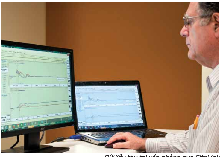
Dữ liệu thu tại văn phòng qua SiteLink